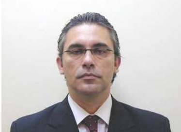
Diputado de la Nación REMO GERARDO CARLOTTO FRENTE PARA LA VICTORIA - PJ Distrito: BUENOS AIRES Mandato: 10/12/2009 - 09/12/2013 Teléfono: 6310-7100 E-Mail: rcarlotto@diputados.gov.ar