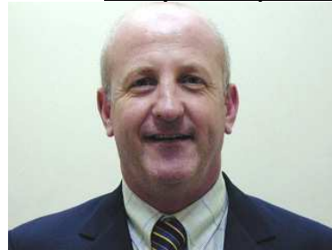
Diputado de la Nación LISANDRO ALFREDO VIALE PARTIDO SOCIALISTA Distrito: ENTRE RIOS Mandato: 10/12/2007 - 09/12/2011 Teléfono: 6310-7100 E-Mail: lviale@diputados.gov.ar