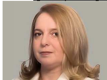
Diputada de la Nación SILVANA MYRIAM GIUDICI UCR Distrito: CIUDAD de BUENOS AIRES Mandato: 10/12/2007 - 09/12/2011 Teléfono: 6310-7100 E-Mail: sgjudici@diputados.gov.ar