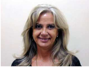
Diputada de la Nación MARIA INES PILATTI VERGARA FRENTE PARA LA VICTORIA - PJ Distrito: CHACO Mandato: 10/12/2009 - 09/12/2013 Teléfono: 6310-7100 E-Mail: mpilattiv@diputados.gov.ar