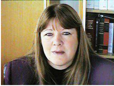
Diputada de la Nación MARGARITA ROSA STOLBIZER GEN Distrito: BUENOS AIRES Mandato: 10/12/2009 - 09/12/2013 Teléfono: 6310-7100 E-Mail: mstolbizer@diputados.gov.ar