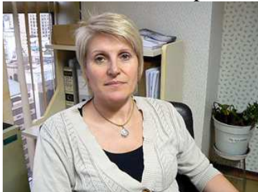
Diputada de la Nación NELIDA BELOUS PROYECTO PROGRESISTA Distrito: TIERRA DEL FUEGO Mandato: 10/12/2007 - 09/12/2011 Teléfono: 6310-7100 E-Mail: nbelous@diputados.gov.ar