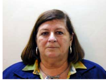
Diputada de la Nación MARIA LUISA STORANI UCR Distrito: BUENOS AIRES Mandato: 10/12/2009 - 09/12/2013 Teléfono: 6310-7100 E-Mail: mstorani@diputados.gov.ar