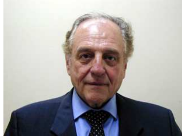
Diputado de la Nación CARLOS SALOMON HELLER NUEVO ENCUENTRO POPULAR Y SOLIDARIO Distrito: CIUDAD de BUENOS AIRES Mandato: 10/12/2009 - 09/12/2013 Teléfono: 6310-7100 E-Mail: cheller@diputados.gov.ar