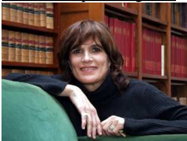
Diputada de la Nación GLORIA BIDEGAIN FRENTE PARA LA VICTORIA - PJ Distrito: BUENOS AIRES Mandato: 10/12/2007 - 09/12/2011 Teléfono: 6310-7100 E-Mail: gbidegain@diputados.gov.ar