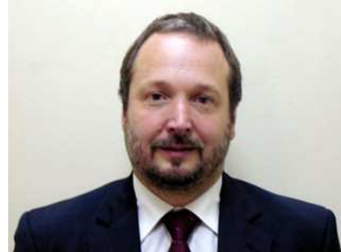
Diputado de la Nación MARTIN SABBATELLA NUEVO ENCUENTRO POPULAR Y SOLIDARIO Distrito: BUENOS AIRES Mandato: 10/12/2009 - 09/12/2013 Teléfono: 6310-7100 E-Mail: msabbatella@diputados.gov.ar