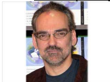
Diputado de la Nación FERNANDO ADOLFO IGLESIAS COALICION CIVICA Distrito: CIUDAD de BUENOS AIRES Mandato: 10/12/2007 - 09/12/2011 Teléfono: 6310-7100 E-Mail: figlesias@diputados.gov.ar