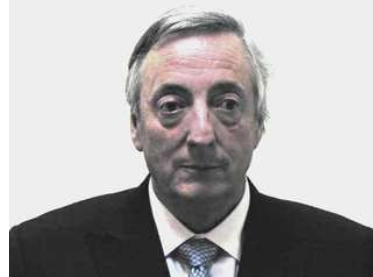
Diputado de la Nación NESTOR CARLOS KIRCHNER FRENTE PARA LA VICTORIA - PJ Distrito: BUENOS AIRES Mandato: 10/12/2009 - 09/12/2013 Teléfono: 6310-7100 E-Mail: nkirchner@diputados.gov.ar