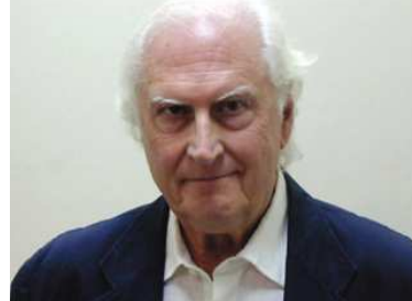
Diputado de la Nación FERNANDO EZEQUIEL SOLANAS MOVIMIENTO PROYECTO SUR Distrito: CIUDAD de BUENOS AIRES Mandato: 10/12/2009 - 09/12/2013 Teléfono: 6310-7100 E-Mail: fsolanas@diputados.gov.ar