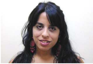
Diputada de la Nación VICTORIA ANALIA DONDA PEREZ LIBRES DEL SUR Distrito: BUENOS AIRES Mandato: 10/12/2007 - 09/12/2011 Teléfono: 6310-7100 E-Mail: vdondap@diputados.gov.ar