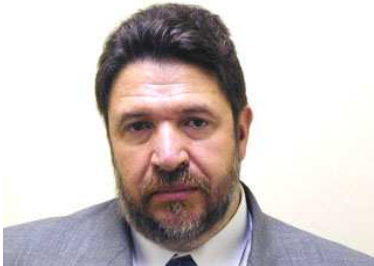
Diputado de la Nación CLAUDIO LOZANO MOVIMIENTO PROYECTO SUR Distrito: CIUDAD de BUENOS AIRES Mandato: 10/12/2007 - 09/12/2011 Teléfono: 6310-7100 E-Mail: clozano@diputados.gov.ar