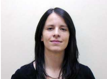
Diputada de la Nación SOLEDAD MARTINEZ PRO Distrito: BUENOS AIRES Mandato: 10/12/2009 - 09/12/2013 Teléfono: 6310-7100 E-Mail: smartinez@diputados.gov.ar