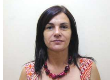
Diputada de la Nación SANDRA ADRIANA RIOBOO UCR Distrito: BUENOS AIRES Mandato: 10/12/2007 - 09/12/2011 Teléfono: 6310-7100 E-Mail: srioboo@diputados.gov.ar