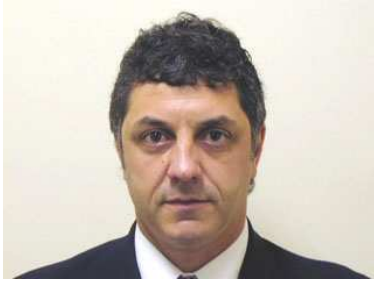
Diputado de la Nación GUSTAVO ANGEL MARCONATO FRENTE PARA LA VICTORIA - PJ Distrito: SANTA FE Mandato: 10/12/2007 - 09/12/2011 Teléfono: 6310-7100 E-Mail: gmarconato@diputados.gov.ar