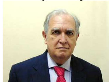
Diputado de la Nación RICARDO RODOLFO GIL LAVEDRA UCR Distrito: CIUDAD de BUENOS AIRES Mandato: 10/12/2009 - 09/12/2013 Teléfono: 6310-7100 E-Mail: rgill@diputados.gov.ar