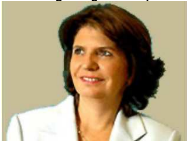
Diputada de la Nación PATRICIA BULLRICH COALICION CIVICA Distrito: CIUDAD de BUENOS AIRES Mandato: 10/12/2007 - 09/12/2011 Teléfono: 6310-7100 E-Mail: pbullrich@diputados.gov.ar