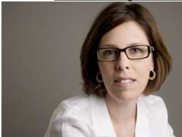
Diputada de la Nación LAURA ALONSO PRO Distrito: CIUDAD de BUENOS AIRES Mandato: 10/12/2009 - 09/12/2013 Teléfono: 6310-7100 E-Mail: lalonso@diputados.gov.ar