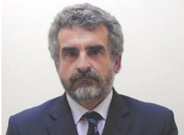
Diputado de la Nación AGUSTIN OSCAR ROSSI FRENTE PARA LA VICTORIA - PJ Distrito: SANTA FE Mandato: 10/12/2009 - 09/12/2013 Teléfono: 6310-7100 E-Mail: arossi@diputados.gov.ar