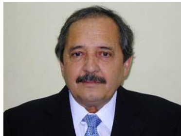
Vicepresidente 1° RICARDO LUIS ALFONSIN UCR Distrito: BUENOS AIRES Mandato: 10/12/2009 - 09/12/2013 Teléfono: 6310-7100 E-Mail: ralfonsin@diputados.gov.ar