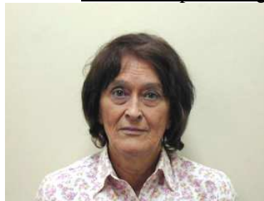
Diputada de la Nación ALCIRA SUSANA ARGUMEDO MOVIMIENTO PROYECTO SUR Distrito: CIUDAD de BUENOS AIRES Mandato: 10/12/2009 - 09/12/2013 Teléfono: 6310-7100 E-Mail: aargumedo@diputados.gov.ar