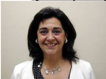
Diputada de la Nación CLAUDIA FERNANDA GIL LOZANO COALICION CIVICA Distrito: CIUDAD de BUENOS AIRES Mandato: 10/12/2007 - 09/12/2011 Teléfono: 6310-7100 E-Mail: cgill@diputados.gov.ar