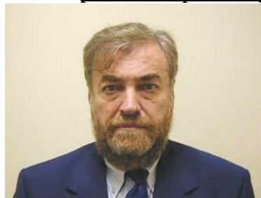
Diputado de la Nación MIGUEL LUIS BONASSO DIALOGO POR BUENOS AIRES Distrito: CIUDAD de BUENOS AIRES Mandato: 10/12/2007 - 09/12/2011 Teléfono: 6310-7100 E-Mail: mbonasso@diputados.gov.ar