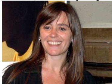
Diputada de la Nación JULIANA DI TULLIO FRENTE PARA LA VICTORIA - PJ Distrito: BUENOS AIRES Mandato: 10/12/2009 - 09/12/2013 Teléfono: 6310-7100 E-Mail: jditullio@diputados.gov.ar