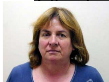
Diputada de la Nación HILMA LEONOR RE COALICION CIVICA Distrito: ENTRE RIOS Mandato: 10/12/2009 - 09/12/2013 Teléfono: 6310-7100 E-Mail: hre@diputados.gov.ar